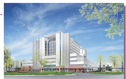
新病院外観イメージ図

1930年診療開始。仙台市民に信頼される利用しやすい地域の中核病院として、また安全・安心な市民生活に欠くことのできない政策的医療(救急医療、小児医療、災害医療等)を提供する中心的な病院のひとつとして、市民の健康と生命を守る役割を果たしてきた。現在の病院は、建築から30年以上が経過し、敷地・建物の狭隘化、設備面での老朽化等が課題となったため現在、新病院の整備を進行中。免震性とヘリポートを備え、安心、安全で地域に開かれた病院を標榜し、26年度中の開院を目指している。